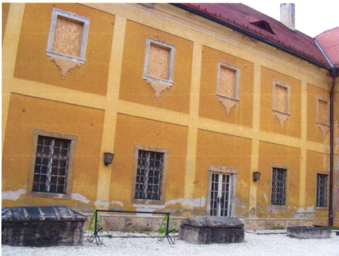
A helyreállított ablakkeretek a külső szárnyon.