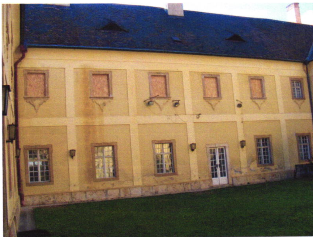
A belső udvar nyugati oldala a kivett ablaktokkal.

A feladatunkat az után tudtuk elkezdni, hogy az ablaktokokat a farestaurátor vállalkozó elbontotta és elszállította. A helyszínt úgy vettük át, hogy a nyílásokat egy „OSB”lap takarta, ékekkel a falhoz feszítve, amit a munka során le lehetett szerelni.