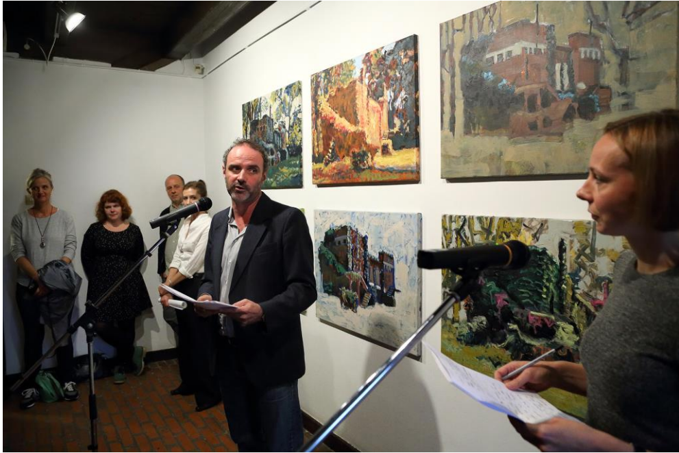
Megnyitotta: WOLFGANG SCHNEIDER