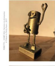
FISCHER Judit / Tárgyak, 2019