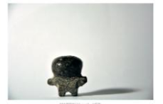
FISCHER Judit / Tárgyak, 2019

The exhibition is the fourth in a series of annual exhibitions (began in 2013) the focus of which is always one particular type of artistic behaviour. The common trait in the present case is not just the often highly personal relationship between the creator of the works of art and their owners, but the works' connection to a specific time and possibly a certain life event. Works created under such circumstances often entail a deep understanding of the person to whom they are given as a present. With their current inclusion in a group show, many of the works on display have come into the public sphere for the first time. By sharing with visitors to the exhibition the stories behind each gifting, we seek to further a more nuanced understanding of these works, and so a brief narrative recounting this act has been included along with each object. The strong material presence of the exhibited artefacts draws attention to an opposition between gift as object and gift as social act, an opposition ever more palpable at a time when experience gifting is becoming increasingly common.