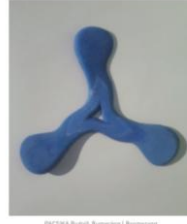
FISCHER Judit / Tárgyak, 2019