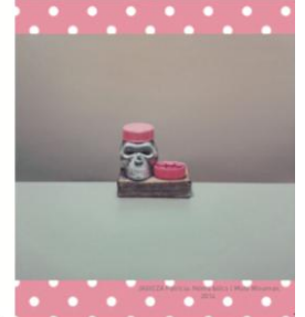
FISCHER Judit / Tárgyak, 2019

A kiállítás kurátorai | Curators: SZABÓCS Zsuzsanna, SZEDEYI-MASZAR Zsuzsanna Budapest Galéria, 2019, június 22. - május 18. Megnyitja | Opening speech: MELIÚ JACINT