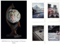
ANTIK / Bekötés, 2019