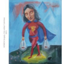
FISCHER Judit / Tárgyak, 2019