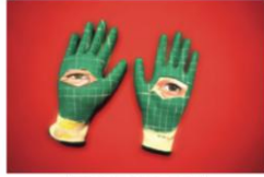
CSABÓ László / Kéz, 2011