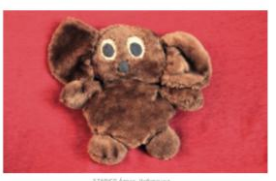
ANTIK / Bekötés, 2019