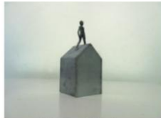
CSABÓ László / Kéz, 2011