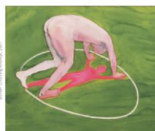
FISCHER Judit / Tárgyak, 2019

The exhibition is the fourth in a series of annual exhibitions (began in 2013) the focus of which is always one particular type of artistic behaviour. The common trait in the present case is not just the often highly personal relationship between the creator of the works of art and their owners, but the works' connection to a specific time and possibly a certain life event. Works created under such circumstances often entail a deep understanding of the person to whom they are given as a present. With their current inclusion in a group show, many of the works on display have come into the public sphere for the first time. By sharing with visitors to the exhibition the stories behind each gifting, we seek to further a more nuanced understanding of these works, and so a brief narrative recounting this act has been included along with each object. The strong material presence of the exhibited artefacts draws attention to an opposition between gift as object and gift as social act, an opposition ever more palpable at a time when experience gifting is becoming increasingly common.