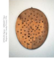
FISCHER Judit / Tárgyak, 2019